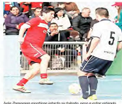
Iván Zamorano mantiene intacto su talento, pese a estar retirado.

El equipo está muy bien constituido. El tema de la definición